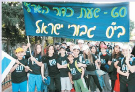
"הולכים על תל-אביב"; בתיאום כסוכני השפעה על ההתנהגות החברתית