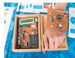
סיוע לחירש. חיישן יד ומערכת תמיכה

רובוט משחק כדורגל - פרויקט שזכה בתואר "חביב הקהל"; רובוט שנוסע על שני גלגלים, תופס כדור וחוזר איתו לשער. הרובוט מבוקר מחשב ונע באמצעות חיישנים, המאפשרים לו להמיר מידע מן הסביבה למידע חשמלי המוזן לבקר הרובוט. הכדור פולט קרינה אינפרה אדומה, אותה מזהים חיישני הרובוט, וכך הוא פונה בעקבות הכדור. הרובוט שולח באופן אלחוטי את כל הפעולות אותן הוא מבצע אל המחשב, אשר במקביל מבצע סימולציה של תנועת הרובוט ויכול לשלוט בו מהצד.