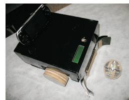
רובוט משחק כדורגל. העתיד כבר כאן

רשת תקשורת נתונים - פרויקט שזכה במקום הראשון בתחום הצבא; מערכת המאפשרת העברת נתונים ממחשב למחשב (קבצים, שיחות טלפון, תמונות, וידאו וכו') דרך קו מאובטח ומקודד. כאשר ישנה תקלה בהעברת הנתונים, מתקבלת הודעת שגיאה המעדכנת את המשתמש במדויק מהי התקלה.