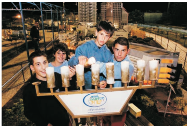
תלמידים בפעילות במיני ישראל; הדלקת נרות בחנוכה.

המאפשרים לימוד רחב מעמיק לפי צרכי בית הספר (כגון 60 שנה למדינה, 40 שנה לאיחוד ירושלים, חבלי הארץ ועוד) ומסלול בית ספרי ייחודי הכולל תוכנית סיורים המתבססת על תוכנית הלימודים והחזון הבית ספרי. מסלול ייחודי "בנתיבי 60 למדינה", מציע סיורים חווייתיים מרתקים עם קבוצות האתרים המהווים ציוני דרך לכל אחד מעשורי המדינה, "פעילות מיני ט"ו בשבט" להכרת חבלי הארץ והצומח האופייני לו בגובה העיניים של הילדים (מיניאטורי), וחגיגת מיני ביכורים לעולים לרגל לירושלים. במסגרת פעילות זו תלמידי בתי הספר יצעדו על פי המסורת עתיקת היומין בשבילי מיני ישראל בשיר ובריקוד וישתתפו בטקסי ביכורים ברחבה הקרובה לירושלים באווירה של פעם... כל קבוצה