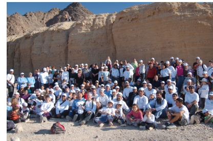
המורים המצטיינים של רשת אמי"ת ובני משפחותיהם במהלך טיול בהרי אילת.

■ התלמידים מביה"ס היהודי ומביה"ס הערבי יחברו ביחד "סיפור משותף" – מפגש היכרות בין תלמידי שכבת ט' בחטיבת הביניים הראשונים בגני תקווה וחטיבה ב' מטירה, נערך בחודש שעבר. המפגש התקיים בחטיבת הראשונים במסגרת קדם ניסוי למיזם בשם "סיפור משותף". במסגרת המיזם יחברו התלמידים משני בתיה"ס ביחד ספרי ילדים. במסגרת המפגש השתתפו התלמידים בפעילות בנושא ספרות ילדים. במהלך הפעילות חולקו התלמידים לשתי קבוצות מעורבות, שלוו על ידי מורות משני בתיה"ס. כל תלמיד הציג את עצמו ואת ספר הילדים שהביא איתו בפני הקבוצה. אחר כך עבדו התלמידים בזוגות, כשבכל אחד מהם תלמיד יהודי ותלמיד ערבי, ומילאו דפי היכרות זה על זה. בהמשך היום התקיימה פעילות ספורטיבית משותפת – משחקי כדורגל וכדורסל. לאחר מכן חזרו התלמידים לכיתות וקראו את סיפור הילדים "איתמר פוגש ארנב", מאת דוד גרוסמן, בעברית ובתרגום לערבית של אחת המורות. התלמידים דנו בקשר של הסיפור למפגש והעלו רעיונות לספרי ילדים שיכתבו יחד. בסוף המפגש סיכמו אותו התלמידים משני בתיה"ס. התלמידים ציינו שהגיעו למפגש עם חששות, והם יוצאים ממנו עם קשרים חברתיים חדשים, וציפייה להמשך. תוכנית המפגש נבנתה על ידי מורות משני בתיה"ס, בשיתוף עם חברת מטח. ■ ברשת אמי"ת; המורים המצטיינים קיבלו "דמי חנוכה" – 250 מורים מצטיינים ברשת בתיה"ס הממלכתית-דתית אמי"ת ובני משפחותיהם, בילו בשבוע שעבר חופשה בת ארבעה ימים באילת. החופשה הוענקה למורים כבונוס על השקעתם בהוראה.