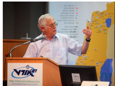
זוכה פרס וולף בפיזיקה, פרופ' יעקב בקנשטיין, מרצה לתלמידים ממגמות המדעים והטכנולוגיה ממספר בתי"ס של רשת אורט.

בדבריו בכנס כיצד מטפחת הרשת את לימודי המדעים. המפגש כלל הרצאה קצרה מפי כל אחד מהמדענים, שאחריה שוחח עם התלמידים וענה לשאלותיהם. כך, למשל, הרצה פרופ' בקנשטיין, מהאוניברסיטה עברית, על החורים השחורים בחלל, והסביר לתלמידים כי ישנה סבירות נמוכה בלבד שכדור