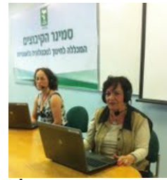
מתנדבות בקו החם של המרכז להורות ומשפחה של סמינר הקיבוצים.

במבצע עמוד ענן פתחה מכללת סמינר הקיבוצים עבור תלמידי הדרום את האפשרות להיכנס לעמוד "לומדים ברשת" ולשמע הרצאות שהועברו על ידי מרצים וסטודנטים. בין היתר יכלו התלמידים להשתתף בשיעורי חשבון, שעת סיפור לכיתות א'-ג', שיעורי אנגלית לכיתות חטיבת הביניים, ושיעורי היסטוריה. בנוסף, הדף הכיל מספר קישורים לאתרים