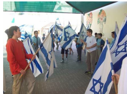
תלמידי בית הספר צוקים בהכנות לקראת כ"ט בנובמבר.

■ בשוהם – שחזור ההצבעה באומות המאוחדות – בבית הספר צוקים בשוהם משוחזרת הבוקר 29.11.12 – כ"ט בנובמבר, ההצבעה באומות המאוחדות על סיום המנדט