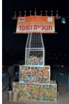
חנוכיית החסד ביבנה בחג חנוכה הקודם.

■ ביבנה – התלמידים יתרמו לחנוכיית החסד – תלמידי העיר יבנה יחלו בקרוב באיסוף קופסאות שימורים והבאתם לבתי הספר והגנים.