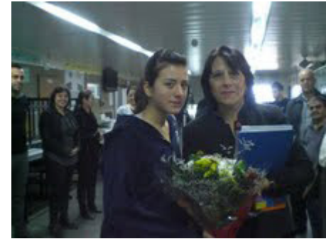
מנהלת המחוז, ד"ר אורנה שמחון, מתקבלת בפרחים במערכת החינוך של חורפיש.

חורפיש מובילה – מנהלת המחוז, ד"ר אורנה שמחון, ביקרה לאחרונה במערכת החינוך בחורפיש. שמחון ביקרה במקיף השש שנתי, שבו 730 תלמידים. בית הספר הוא מדגים בתחום הלוחות החכמים. אחוז הזכאות לבגרות עמד בתשע"ב על 90%.