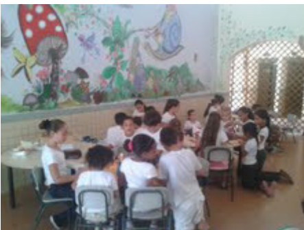
פעילות הפגתית בכיתה ב' בבית ספר בן גוריון בגן יבנה.

חזרה לשגרה – בבית הספר בן-גוריון בגן יבנה התכבדו התלמידים בסוכריות טופי בשער לאחר חזרתם ללימודים לאחר מבצע עמוד ענן. את יום הלימודים פתחו מחנכות הכיתה בשיחות עם התלמידים על התחושות בעקבות המצב, וחוויות מהתקופה בה שהו בבית. בנוסף, נערכו בכיתות, לאורך היום כולו, פעילויות שמטרתן לשחרר מתח, ולהפיג את החרדה בקרב התלמידים, כמו יוגה, מפגשי חונכים-חניכים, הבעה באמצעות יצירה ודרמה, שירים, ריקודים ועוד. גם צוות המורים נהנה מפעילות הפגתית.