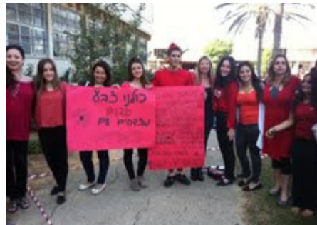
תלמידי קריית החינוך אורט לבוביץ' בנתניה לבשו אדום בזמן מבצע עמוד ענן.

אורט יד לבוביץ' בנתניה הגיעו באחד מימי מבצע עמוד ענן לבושים באדום, כדי להזדהות עם תושבי הדרום. כל