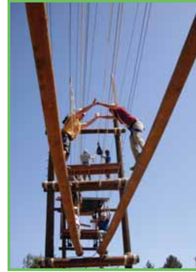
פארק חבלים באריאל

תעודה: לבוגרים שיעמדו בהצלחה במטלות הקורס, במבחן עיוני ובתרגיל מנהיגותי בשטח, תוענק תעודת הסמכה של מנחה סדנאות שטח בשיטת Outdoor Education/Training מטעם המכללה האקדמית בוינגייט.